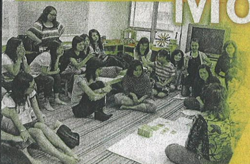
Little Montessorian 去年11月起舉辦蒙特梭利家長班，並每月提供相關課程。