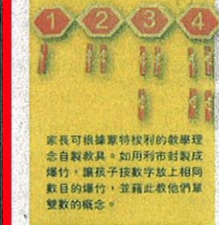
家長可根據蒙特梭利的教學理念自製教具。如用利市封套製成爆竹，讓孩子按數字放上相同數目的爆竹，並藉此教他們單雙數的概念。