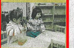
孩子可以玩「喝水」遊戲，但事後要自行抹乾弄濕的地方。