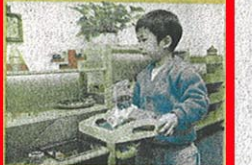
孩子要把玩具放回原位，才可以取另一件玩具。